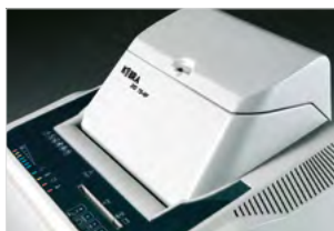
COPERCHIO CON CHIAVE DI SICUREZZA (LK)

Distrugge automaticamente fino a 170 fogli, mentre l'operatore può distruggere contemporaneamente carta, nella bocca principale e CD/DVD/Carte di credito nella fessura dedicata.